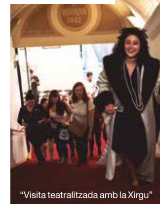
"Visita teatralitzada amb la Xirgu"